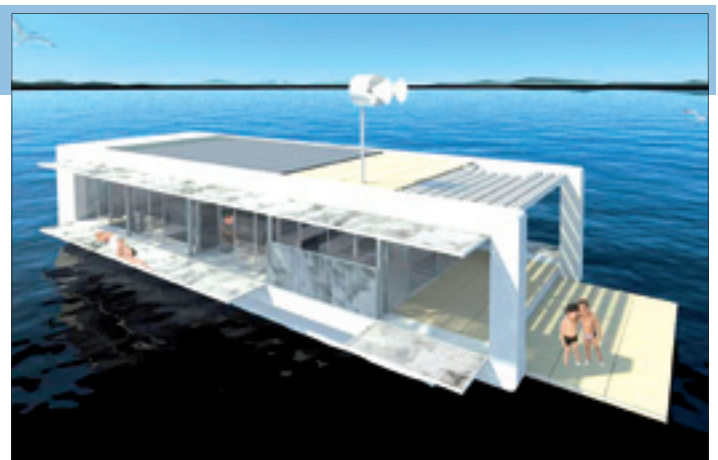
Kein Haus, kein Boot, aber eine Wohnung auf dem Wasser mit allem Drum und Dran. 2012 sollen derartige „Wasserbungalows“ als Markenzeichen für die Landschaft stehen, pardon: schwimmen!

Es haben sich bereits regionale Unternehmen für die Herstellung interessiert. 2012 sollen solche schwimmenden mobilen Architekturen – Sie merken schon: ein zündender Name fehlt noch – durchaus als ein neues Markenzeichen für unsere Seenlandschaft und den Umgang mit der Wasserlandschaft stehen.