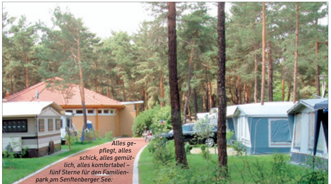
Alles gepflegt, alles schick, alles gemütlich, alles komfortabel – fünf Sterne für den Familienpark am Senftenberger See.

Sehr gut wertete der VCB dabei den Gesamtzustand der Wege und Standplätze sowie die Organisation von vielfältigen Freizeitangeboten. Auch die touristische Beratung und die technische Ausstattung fanden positive Erwähnung bei der Einordnung in die begehrte Kategorie. Die Fünf-Sterne-Klassifizierung gilt nun für drei Jahre – danach müssen sich beide Campingplätze erneut der Bewertungskommission stellen. Aber nicht nur die Camping-Einrichtungen, sozusagen die Hardware, spielen eine wichtige Rolle. Auch auf die Servicequalität, die Software, legt man rund um den Senftenberger See großen Wert.