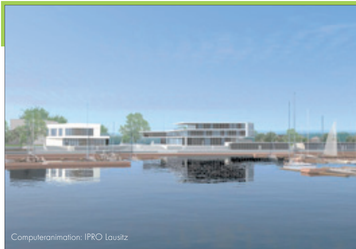
Computeranimation: IPRO Lausitz