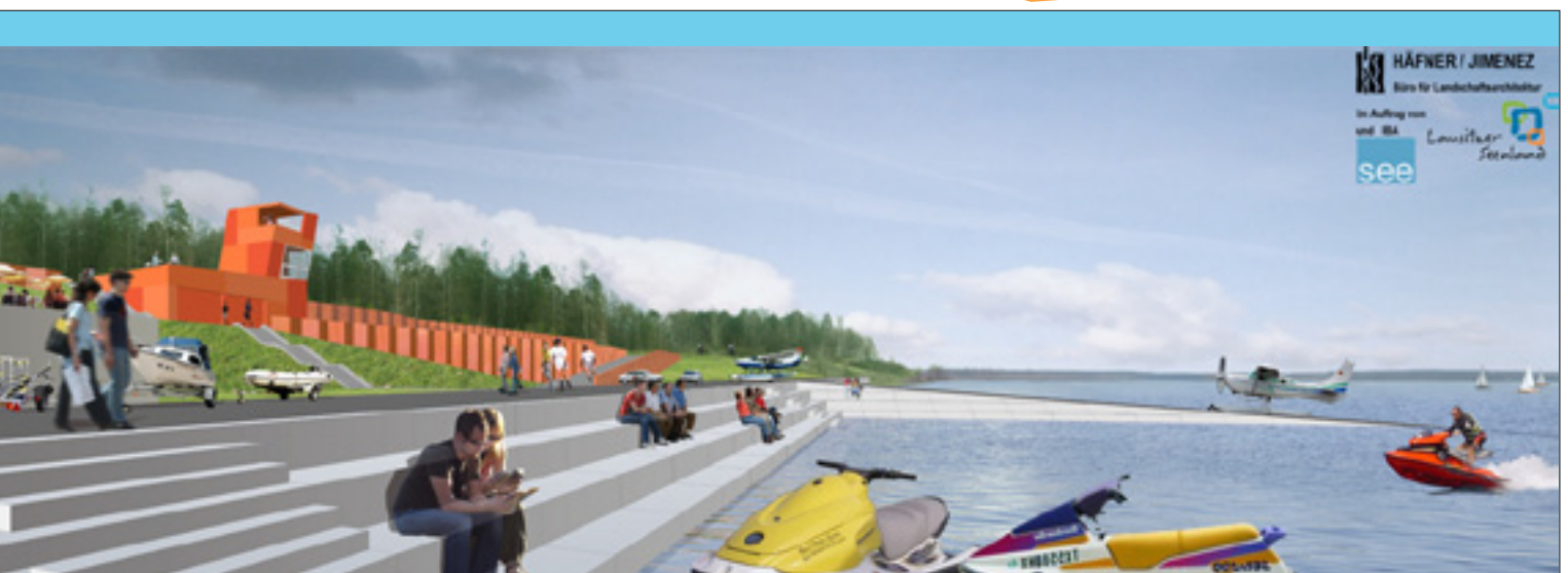
Projektentwicklung wie zum Beispiel beim Marinapark Nordufer (Sedlitzer See) gehören jetzt auch zu den Aufgaben des Zweckverbandes LSB.